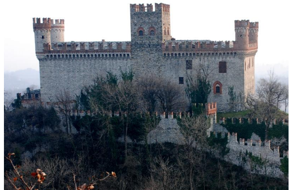
il Castello di Montalto Dora