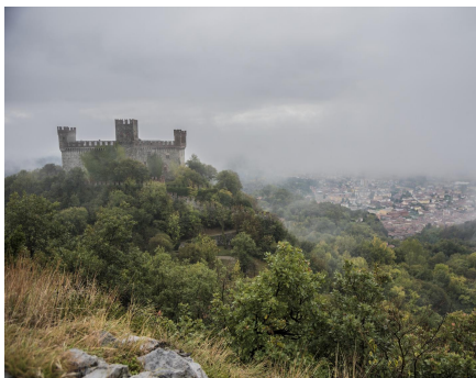
il Castello visto dalla collina del Maggio

Andiamo a scoprire un angolo insolito nello splendido contesto dell'Anfiteatro Morenico d'Ivrea