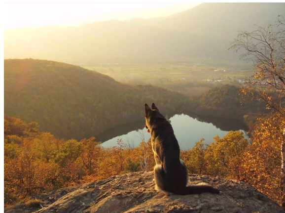
il Lago Nero visto dal punto punto panoramico di Montesino